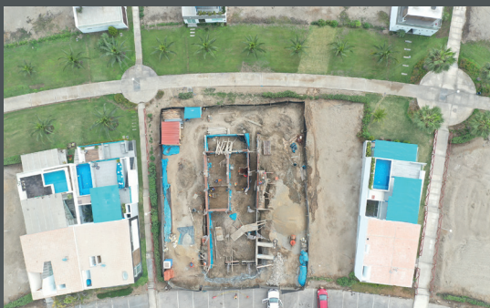
Vista aérea del terreno