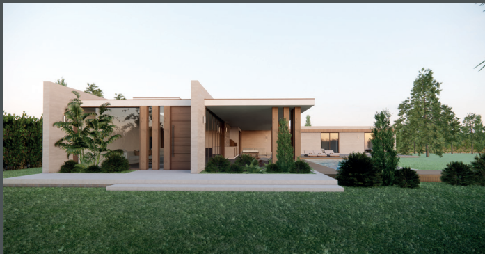
Vista exterior lateral