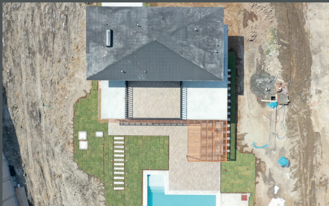
Exterior piscina, noche