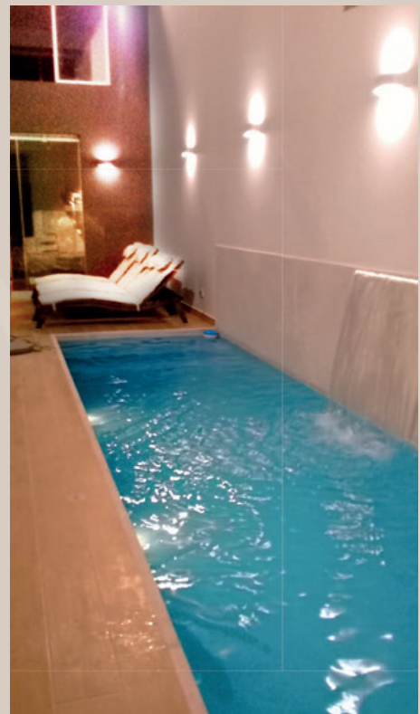
Interior - piscina

El proceso de diseño de una casa de playa, siempre es algo que resulta fascinante. No muchos pueden presenciar totalmente el proceso, observando cada detalle. Por eso en NORTCONS te queremos mostrar el diseño de una casa de playa. Nuestros Proyectos son diseñados por nuestro equipo de ARQUITECTOS especializados en planeamiento, interiorismo y paisajismo. Los estudios preliminares de ingeniería que son estudio de mecánica de suelos para calcular la capacidad portante del suelo, el porcentaje de sales y sulfatos. El estudio de levantamiento topográfico que nos sirve para entender la superficie del terreno y tomar decisiones de corte y relleno. Nuestro equipo de técnicos e ingenieros calculamos y optimizamos el diseño estructural y de otras especialidades.