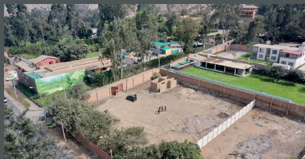
Vista aérea terreno