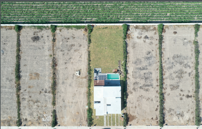
Vista aérea 2