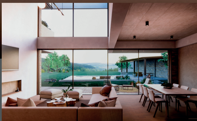
Sala - comedor