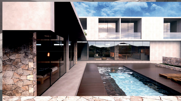
Patio - piscina

La casa Toledo de Cieneguilla de manera intuitiva y con una aproximación sensible al entorno físico, al clima, pero sobre todo al usuario final de esta vivienda, es un primer ejemplo que forma parte de los cimientos de este enfoque de diseño conductual. Es una casa para vivirla, para disfrutarla, para pasarla bien sin pensar en nada más que el propio momento presente. Y ello se consigue con elementos tan sencillos como la escala, los colores y los materiales orgánicos adecuados.