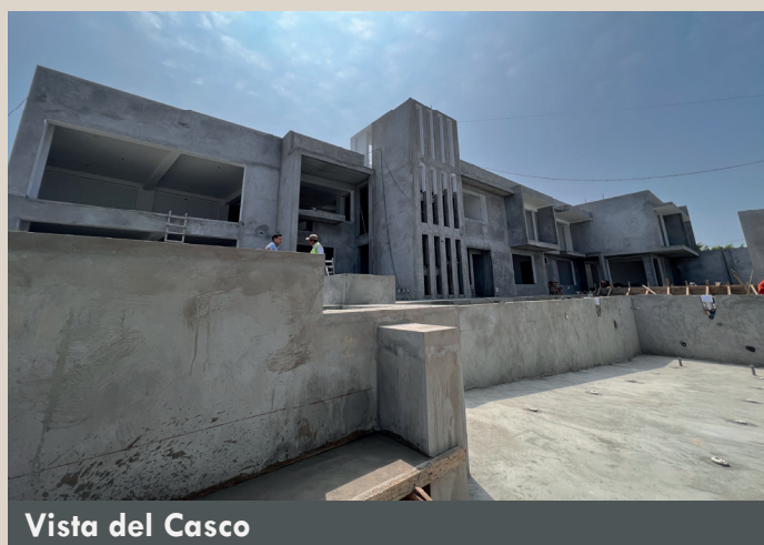
Vista del Casco