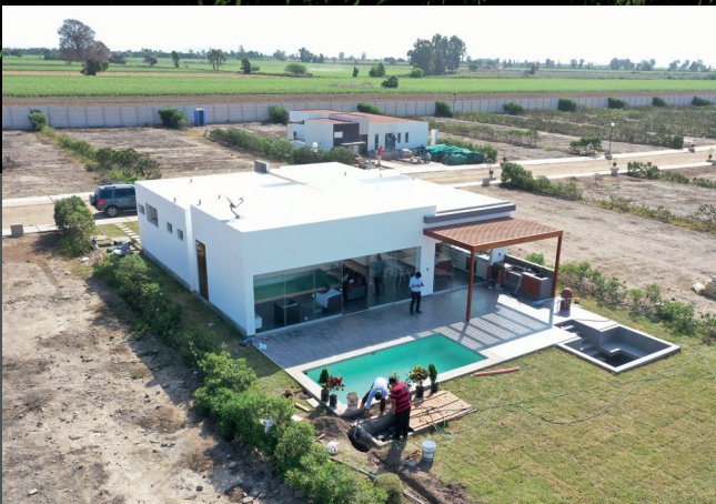
Vista aérea 1